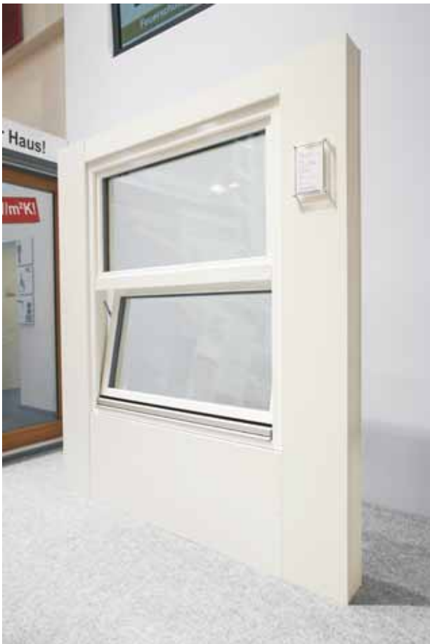
THERMOSLIDE: Passivhauszertifiziertes Vertikal-Schiebe-Fenster