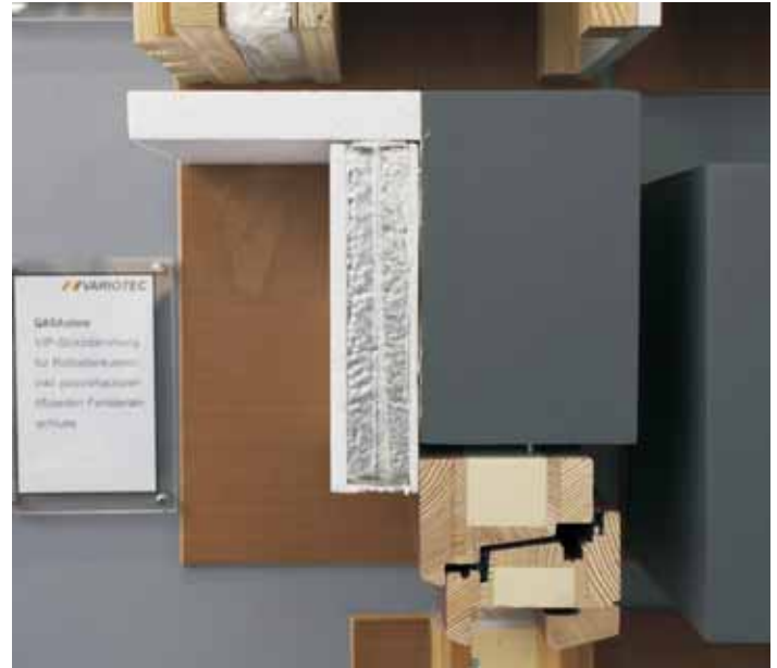
QASASTore: VIP-Sturzdämmung für Rollladenkasten