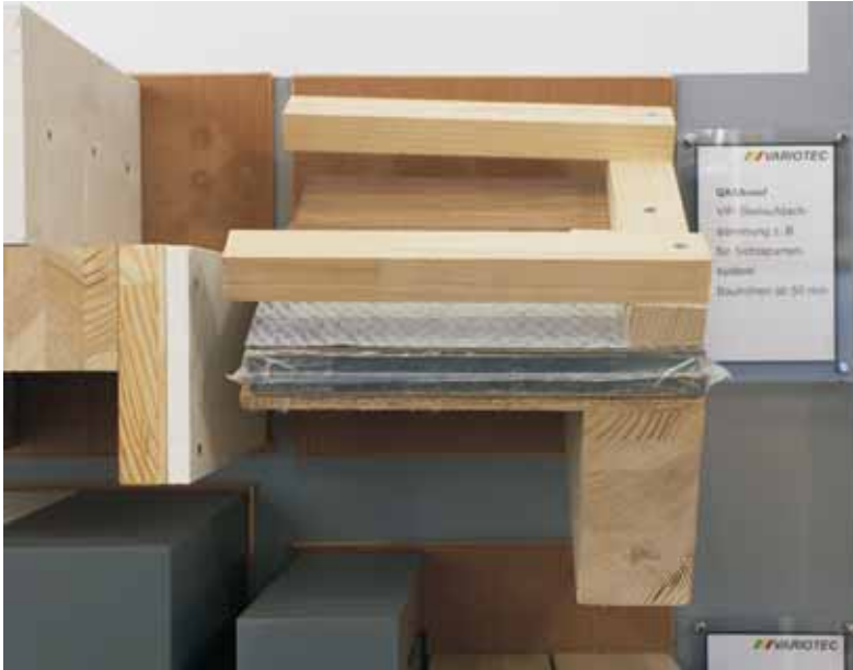
QASARoof: VIP-Steilaufdachdämmung z. B. für Sichtsparrensystem