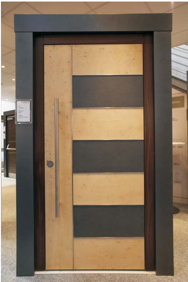
Tür: Apfelbirke Naturstein: Black Rahmen: Santos Palisander