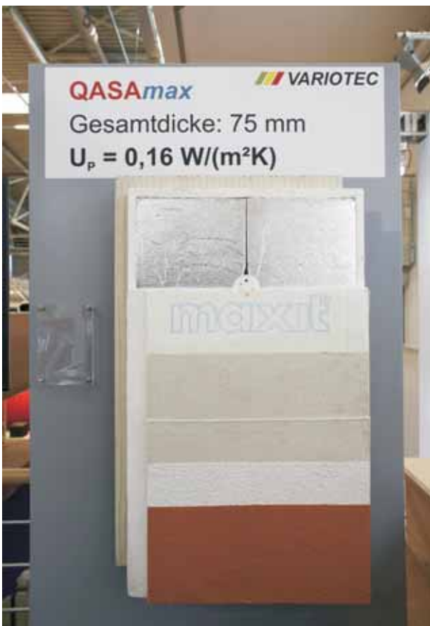
QASAmix: Das Wärmedämm-Verbundsystem mit U_p = 0,16 \text{ W}/(\text{m}^2\text{K})