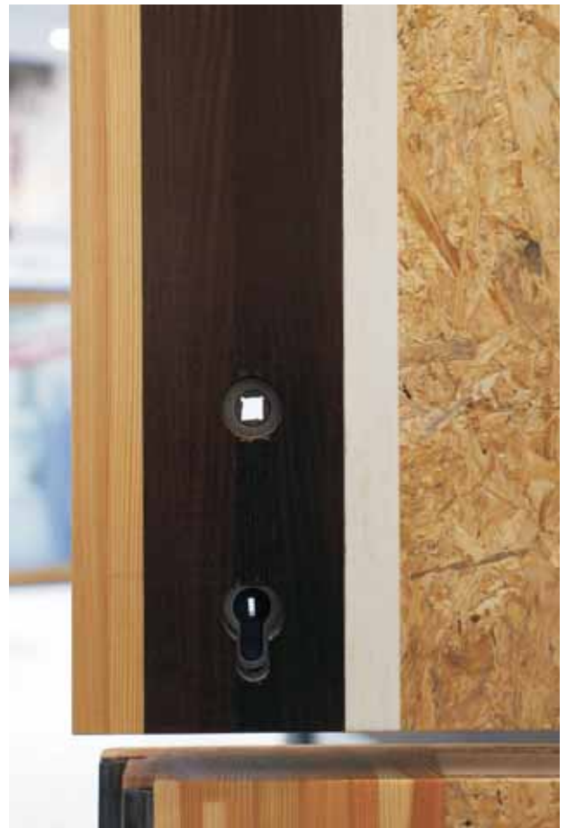
TOL WOOD und FKV: Die Garanten für den sicheren Türenbau