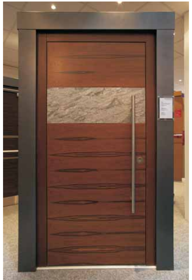
Tür: Santos Palisander/Apfelbirke Naturstein: Silver Shine Rahmen: Bubinga