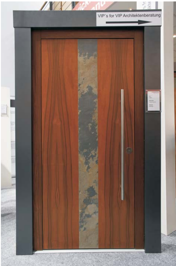
Tür: Tineo Naturstein: Indian Autumn Rahmen: Bubinga