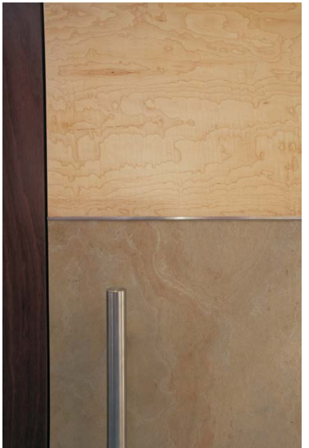
Tür: Ahorn Riegel Naturstein: Tan Rahmen: Amaranth