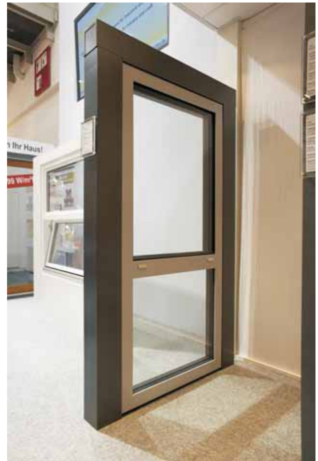
ENEf 12: Holz-Alu-Fenster von 0,81 - 0,90 W/(m 2 K)