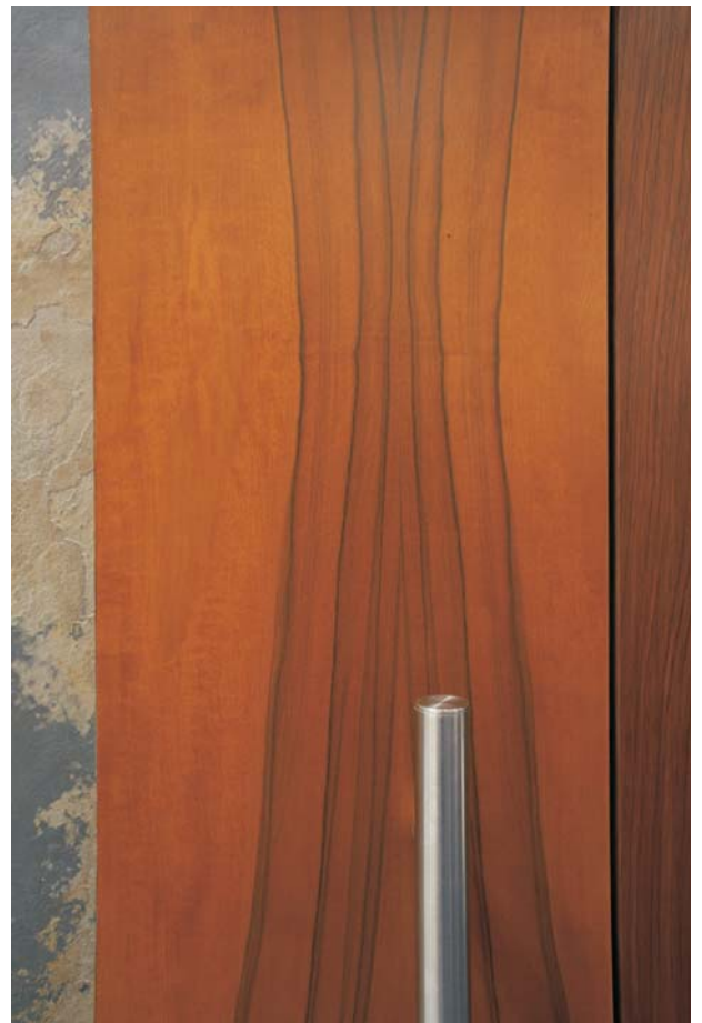
Tür: Tineo Naturstein: Indian Autumn Rahmen: Bubinga