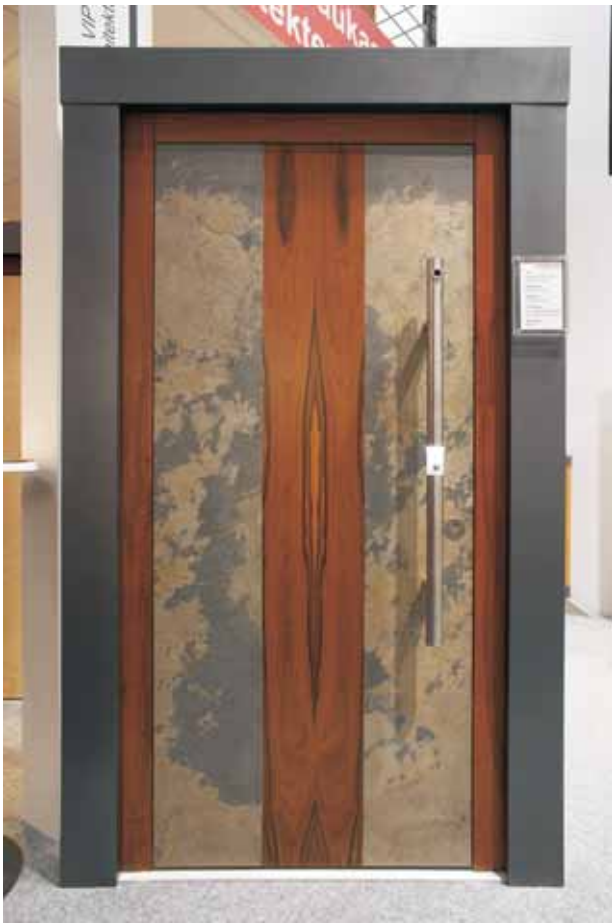
Tür: Santos Palisander Naturstein: Indian Autumn Rahmen: Goncalo Alvez