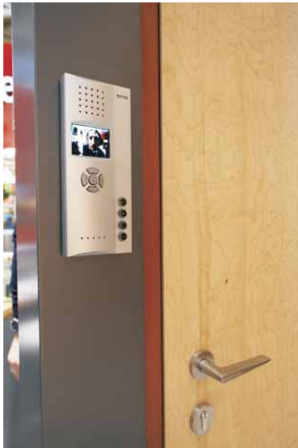
Tür: Santos Palisander/Ahorn Riegel Naturstein: Indian Autumn Rahmen: Goncalo Alvez