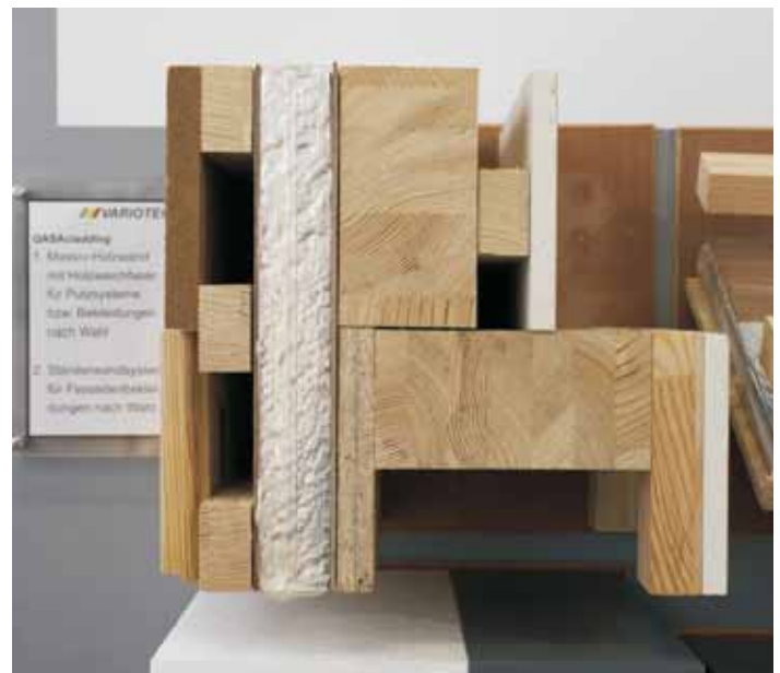
QASAcladding: Massivholzwand mit Holzweichfaser für Putzsysteme bzw. Bekleidungen, Ständerwandsystem für Fassadenbekleidungen nach Wahl