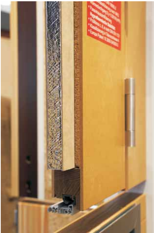
VIP im Außen,- Spezial- und Funktionstürenbau - die Grundlage für hocheffiziente Parameter