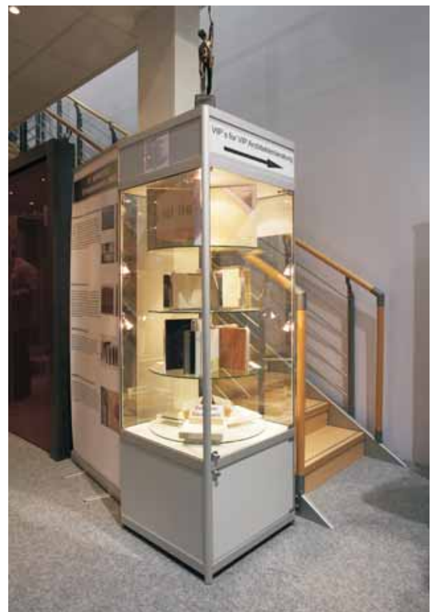
VIP's for VIP: Neue Sandwichkonstruktionen für energieeffiziente Einsatzbereiche