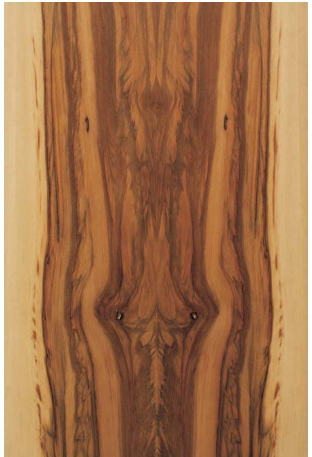
Tür: Satin Nussbaum Naturstein: Indian Autumn Rahmen: Goncalo Alvez