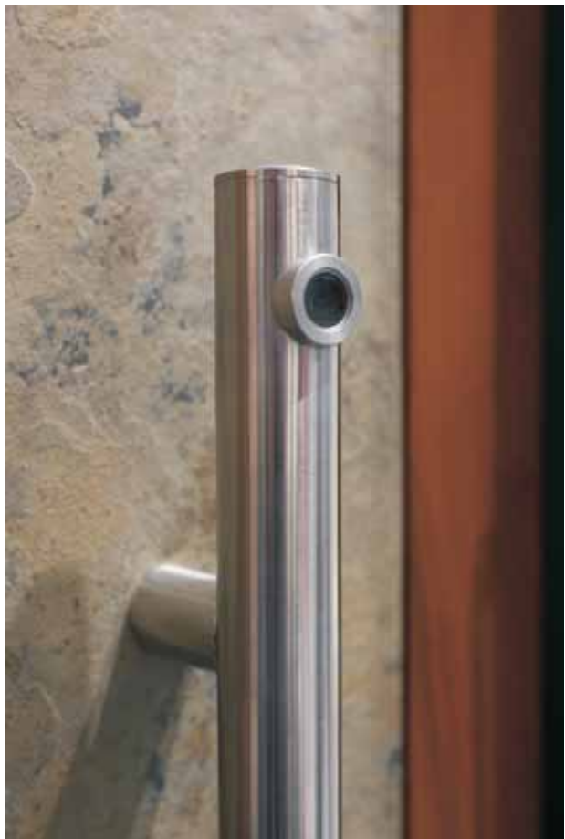
Türstation mit integrierter Kamera, Sprechanlage etc.

Die neue Außen-, Spezial- und Funktionstürenserie NATURA PUR